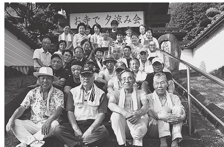
実行委員会のみなさん

昭和48年に閉山された鉱山のほど近くに、8つのそれぞれ異なる宗派の寺院が立ち並ぶ。かつては、銀や銅の採掘に全国から坑夫が集まったため、様々な宗派の寺院が建立され、生野町だけで21もの寺院が現存する。