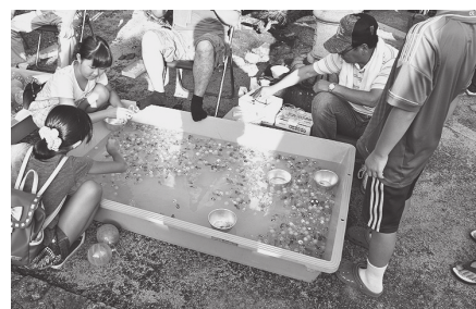
大人も子どもと一緒に楽しむ

年に一度の夕涼み会を楽しみにしているのは子どもたちだけではない。子どもたちを迎え入れる大人たちの笑顔と笑い声が、静かな山村の夏の夕暮れにこだまする。(編集委員・藤川秀行)