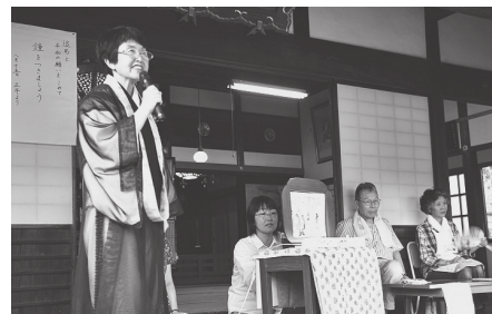
住職のお話と紙芝居

この催しをするきっかけとなったのは、地域の中にある寺の役割を考えたことであったという。自分の寺の名前も、場所さえ知らない子どもたちもいる。このままでは将来誰も寺に来なくなってしまうのではないかという危機感から、子どもたちが楽しみに来れるようなことを始めないかと相談。こうして教徳寺夕涼み会は始まり、昨年は門徒であるなしに関わらず、100人近くの地域の子どもが来場した。